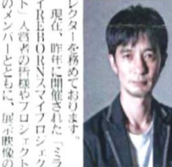
成介氏 映像ディレクター

共創でコンテンツ制作 記憶に残る展示催事を 全日本不動産協会は、2025年大阪・関西万博「大阪ヘルスケアパビリオン」の出展参加者として、同パビリオンに「ミライの都市ゾーン」に出展します。「ミライの都市」ゾーンでは、2050年の未来社会が描かれ、 「未来の社会」づくりへきっかけになる映像を、大阪・関西万博「大阪ヘルスケアパビリオン」に出展される全日本不動産協会の展示映像のテーマを「ミライのスマイ」像を