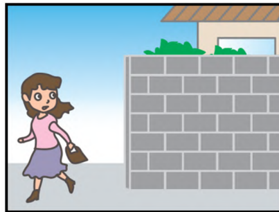
危ない場所から離れて！