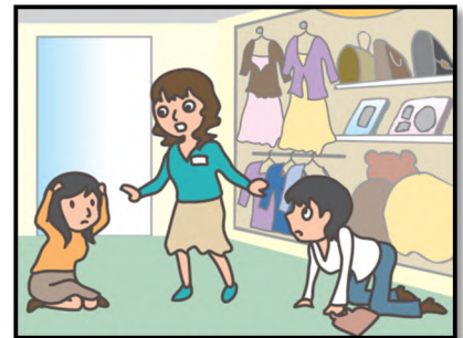
お店では、あわてず係員の指示に従って！