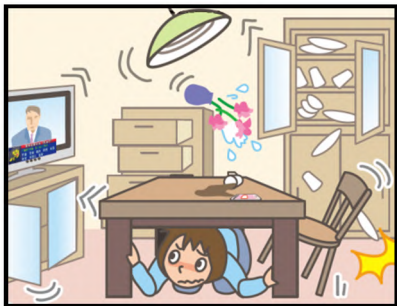
頭を守って、安全な場所に避難！

緊急地震速報を見聞きしたときの行動は、まわりの人に声をかけながら「周囲の状況に応じて、あわてずに、まず身の安全を確保する」ことが基本です。