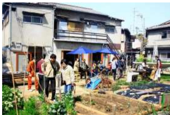
【みんなのうえん北加賀屋】

未利用の空き地をコミュニティ農園へ再生し、クリエイターとオリジナルの農具をつくるワークショップの開催など「アート×農」をテーマに、地域住民の交流を促進