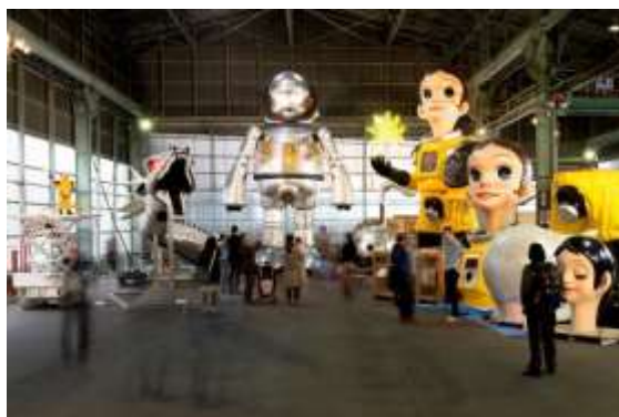
【MASK (MEGA ART STORAGE KITAKAGAYA)】