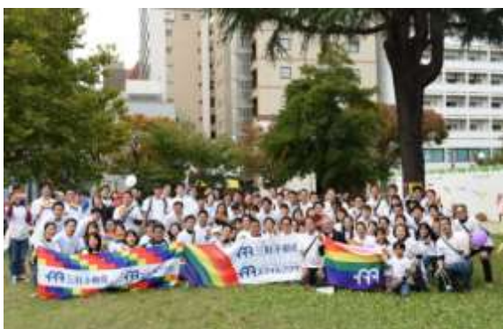
【九州レインボープライドへの参加】

LGBTQを始めとする全ての子どもたちが自分らしく生きていける社会の実現を目的としたパレードに2016年から社員で毎年参加