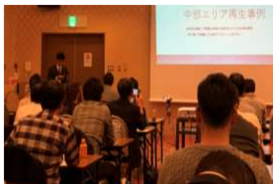
【古家再生投資プランナー®のセミナー】

手がつけられていない状態の空き家を再生専門家(古家再生士®)と一緒に現地で勉強するイベント