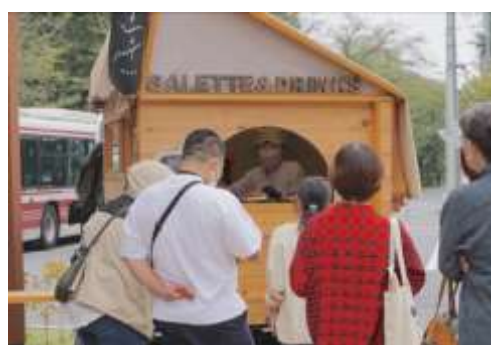
【日替わりで来訪するキッチンカー】

なりわい長屋というコンセプトのもと、バスターミナルを中心とした店舗併用賃貸長屋を核とする地域コミュニティとモビリティの拠点