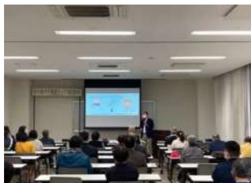
【相続対策セミナー】

暮らし人(ソフト面)の視点から、地域包括支援センター・信用金庫・行政と空き家や空き家になる前の段階での対策を模索