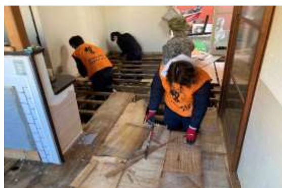
【浸水した家屋の保全活動】

LGBTQを始めとする全ての子どもたちが自分らしく生きていける社会の実現を目的としたパレードに2016年から社員で毎年参加