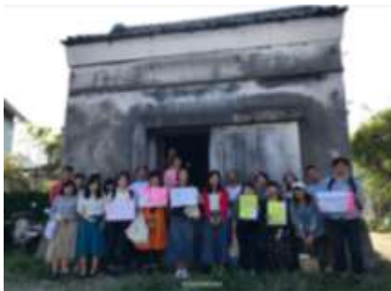
【The Bath & Bed Hayama(ザ バス アンド ベッド ハヤマ)】