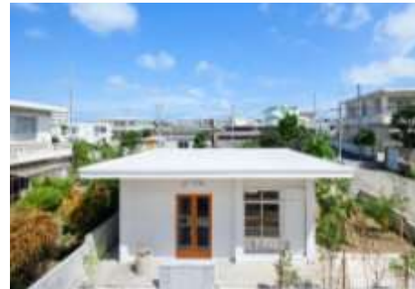
【島民と共につくる、おばあいの宿】

空き家をリノベーションした建物を宿泊施設として活用しながら、コミュニティの拠点とする取組