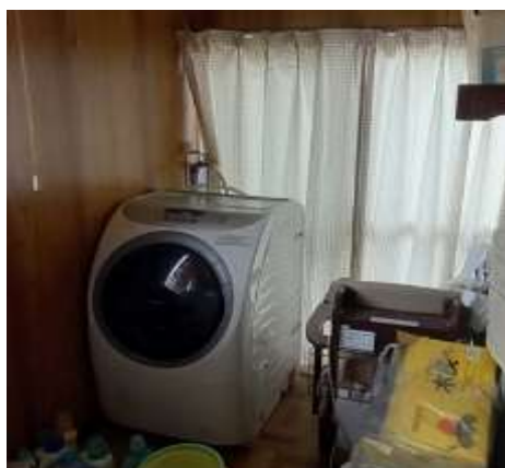
【残置物及び不用品の寄付・提供】

大家等からリユース可能な残置物や不用品を引き取り、社会福祉施設への寄付や入居者への提供を実施