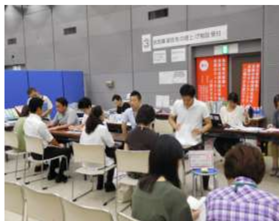
【大規模災害時の行政事務補助】

会員企業や家主に対して、空き家・空室対策ノウハウをはじめ制度改正等に係るセミナーを開催