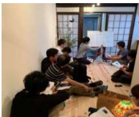
【空き家・古家物件見学ツアー】

手がつけられていない状態の空き家を再生専門家(古家再生士®)と一緒に現地で勉強するイベント