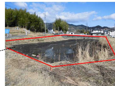
表題部所有者不明土地が解消された土地（ため池）